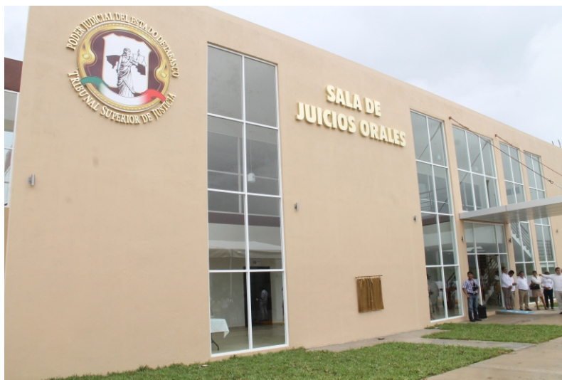
Sala de Juicios Orales

Así como la donación de dos terrenos para la Diócesis de Tabasco: uno de 453.09 m 2 en Villa Chablé y otro de 251.55 m 2 en la Col. Último Esfuerzo; y la donación de una superficie de 763.12 m 2 de la reserva territorial del municipio a favor de la Sociedad Cooperativa de Carpinteros de Montecristo S.C. de R.L. de C.V. el cual sería destinado exclusivamente para la ejecución del Proyecto de sala de exhibición “Muebles y Artesanías de madera”; entre otros.