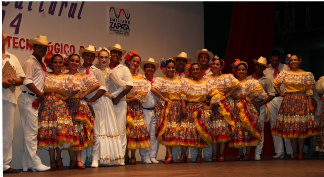
Ballet Folklórico de Baja California Sur