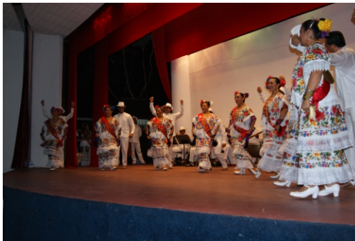
Ballet Folklórico de Yucatán