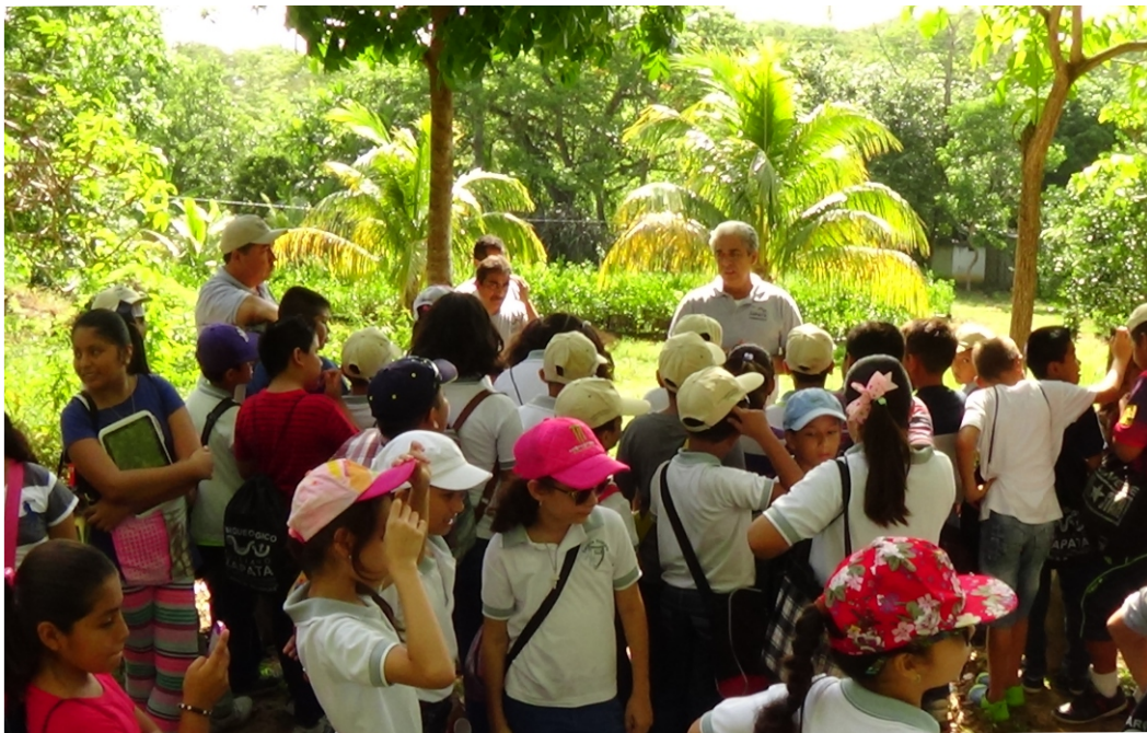
Visita y Recorrido de alumnos de diferentes escuelas al Parqueológico.