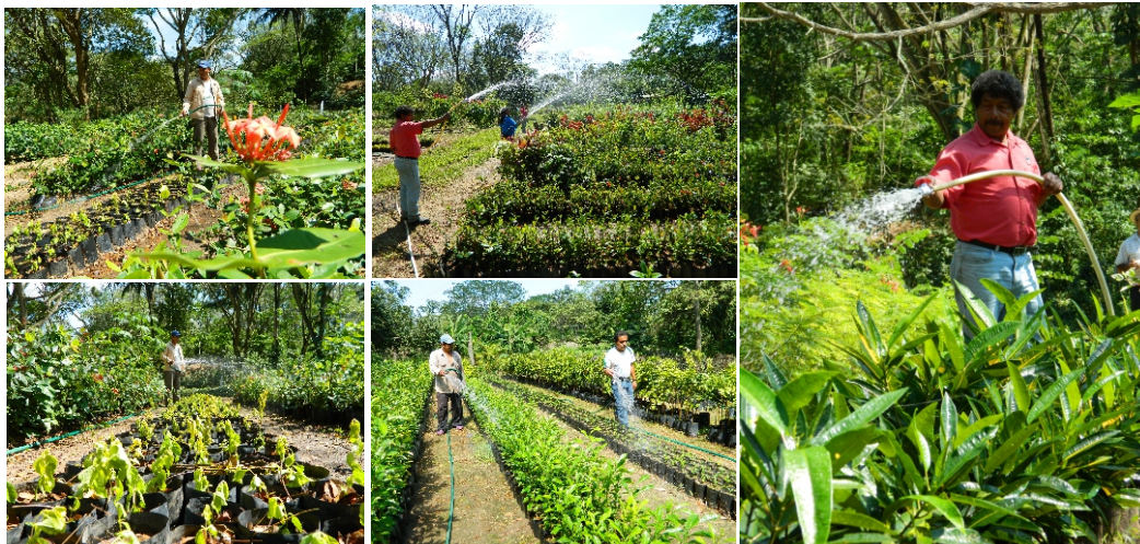
Tabla 4. Concentrado de apoyo social de plantas frutales y ornato.