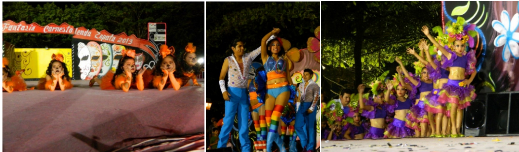
Carnaval 2013. Fantasía Carnestolenda