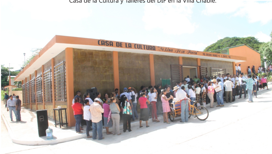
Casa de la Cultura y Talleres del DIF en el Poblado Gregorio Méndez