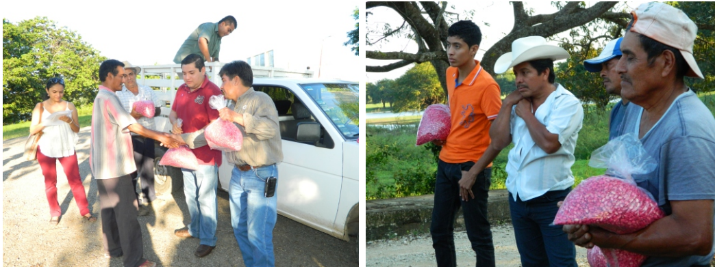
Entrega de Semillas en diversas comunidades.

Otro logro en esta administración fue el apoyo con la labor de desvares en calles de colonias, Instituciones públicas, terrenos, andadores, limpieza de parques, caminos, panteones, instalaciones del Parqueológico de la Flora y la Fauna, avenidas, instituciones y campos deportivos.