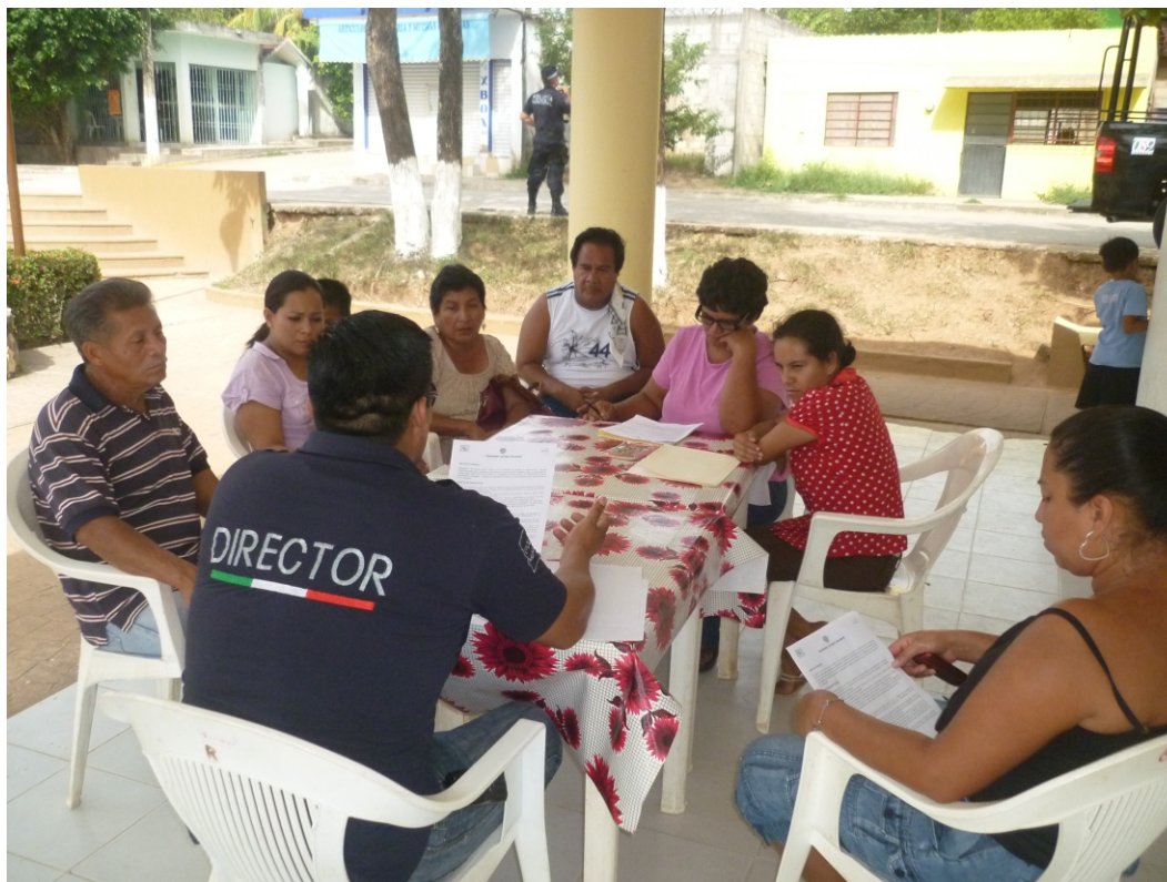
Puesta en marcha del Programa Vecino Vigilante, en las diferentes colonias.