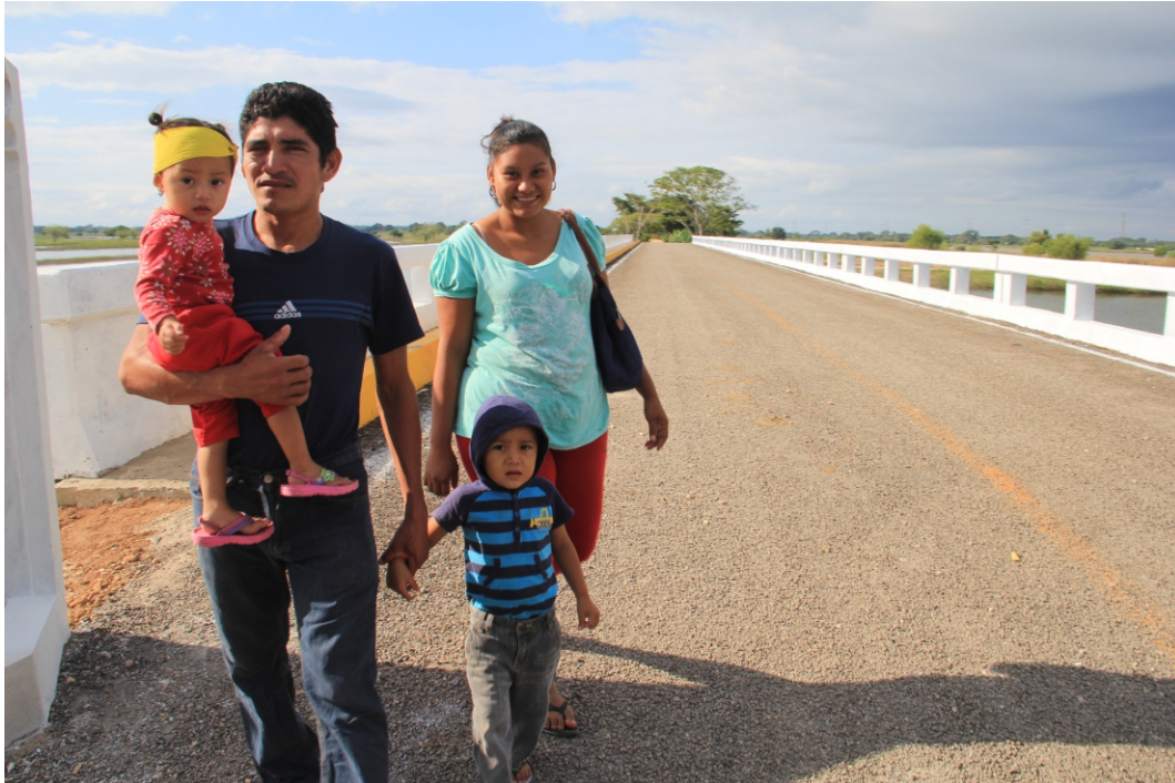
Página 110. Puente Pocvicuc/ Página 111. Puente Jobal