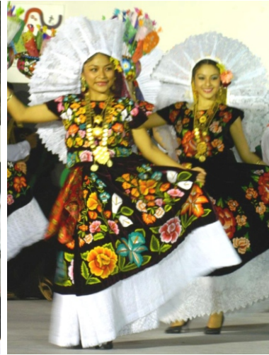
Ballet Folklórico de Oaxaca.