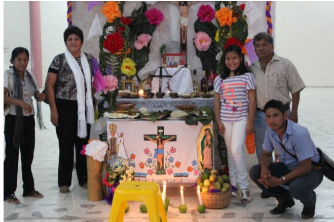
Concursos de Altares