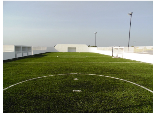
Cancha de Fútbol rápido en la Col. Arboledas