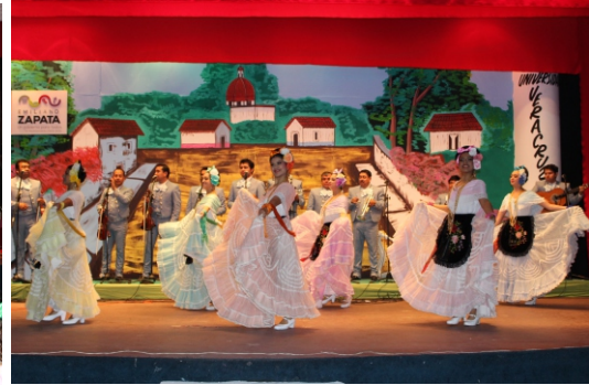
Ballet Folklórico de Veracruz.

Así como el ballet municipal, los integrantes de la marimba municipal y tamborileros se adjudicaron lugares importantes durante las ediciones de la Feria del Estado, como resultado de su profesionalismo en el ámbito musical. En la Feria Tabasco 2013 los tamborileros obtuvieron el primer lugar del concurso estatal y la marimba municipal el segundo lugar; en el año 2014 se logró el Primer Lugar del Encuentro Estatal de Marimbas Infantiles, Primer Lugar en el Encuentro Estatal de Zapateo Tabasqueño Categoría Libre, tras 20 años de no obtener este lugar en un concurso, y una mención honorífica en el Encuentro Estatal de Marimbas; en el año 2015 los tamborileros obtuvieron el primer lugar, y la marimba municipal así como la marimba