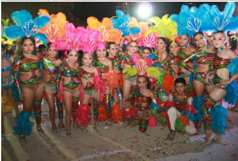
Carnaval 2014. Alegría y Algarabía de mi Pueblo