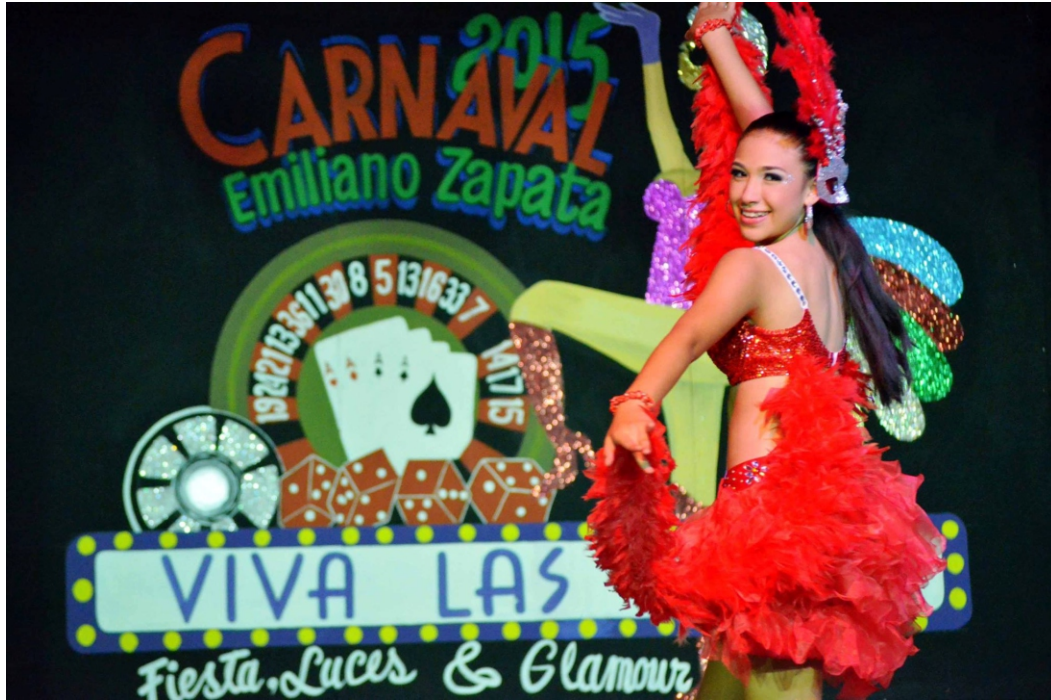
Carnaval 2015. Viva Las Vegas: Fiestas, Luces y Glamour.