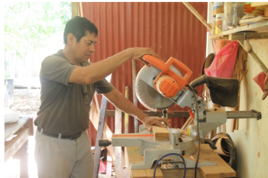
Apoyo a microempresarios