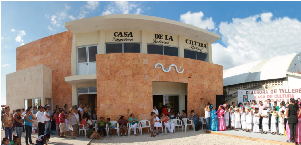
Casa de la Cultura y Talleres del DIF en la Villa Chablé.