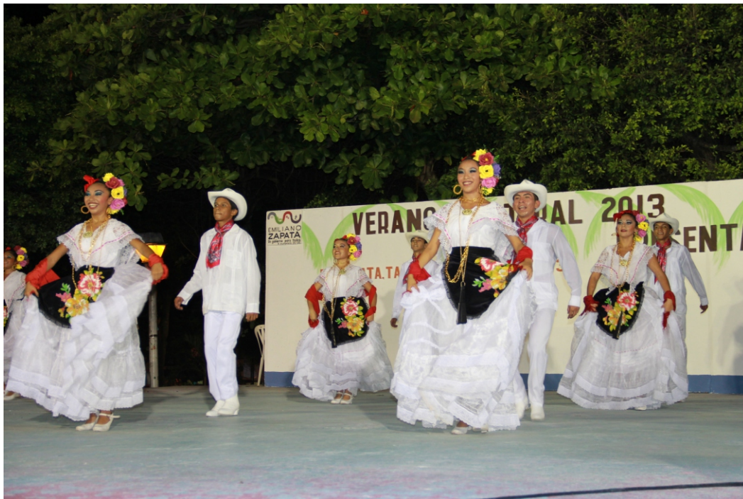
Ballet Folklórico de la Riviera Maya.