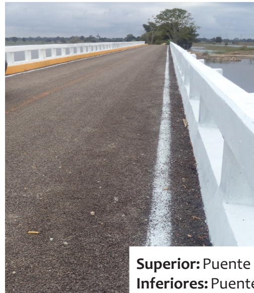
Superior: Puente Pocvicuc Inferiores: Puente Jobal