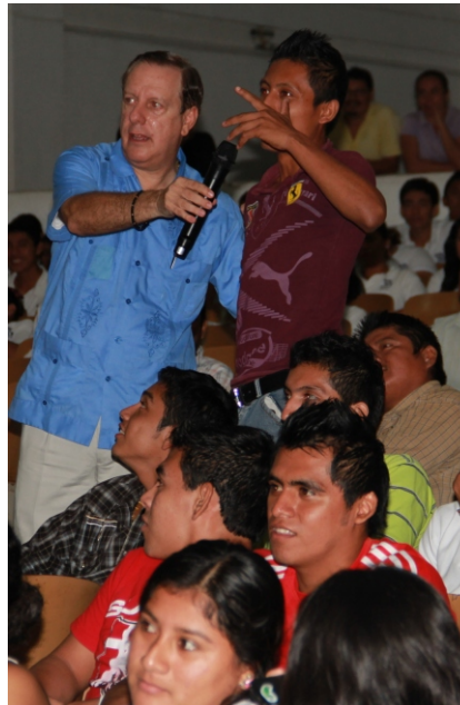
Conferencia “Decisiones con valor” impartida por el Ex Arbitro Internacional Arturo Brizio. 22 de noviembre, 2013. Auditorio de la Casa de la Cultura.